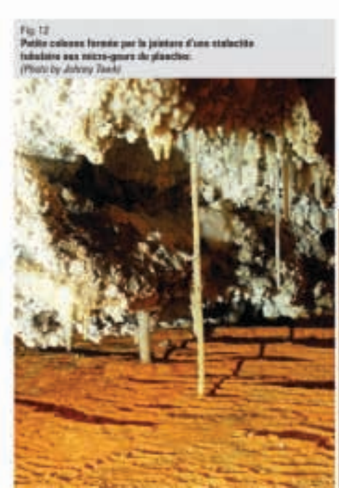
Fig. 12 Petite colonne formée par la jonction d'une stalactite tubulaire aux micro-gours du plancher.