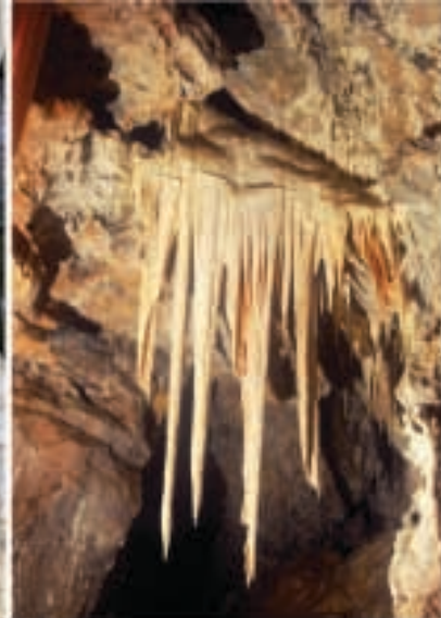
Fig. 10 Stalactite au sein des Galeries.