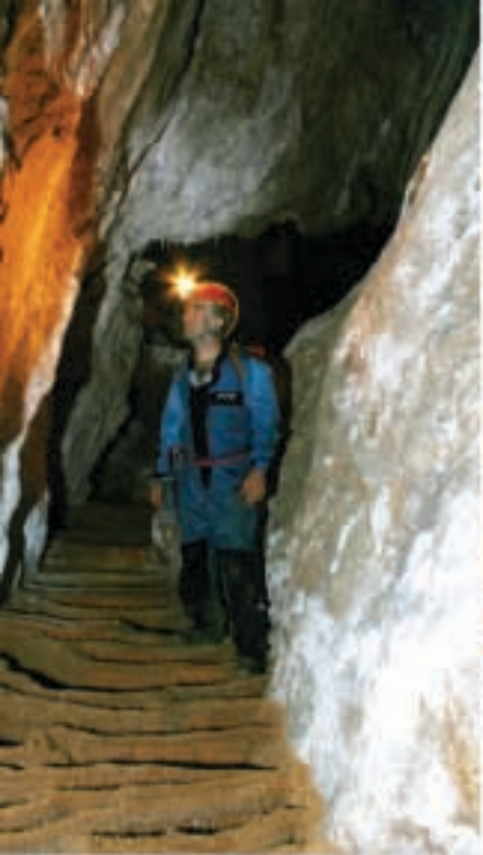
Fig. 3 Gours dans la partie aval des Galeries.