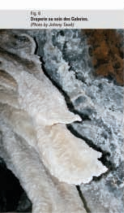
Fig. 6 Draperie au sein des Galeries.

L'auteur remercie les contributions techniques, les commentaires et les avis de Sami Karkabi et de Issam Bou Jaoude.