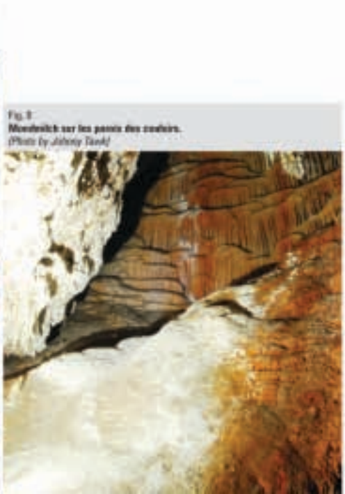
Fig. 8 Mondmilch sur les parois des couloirs.