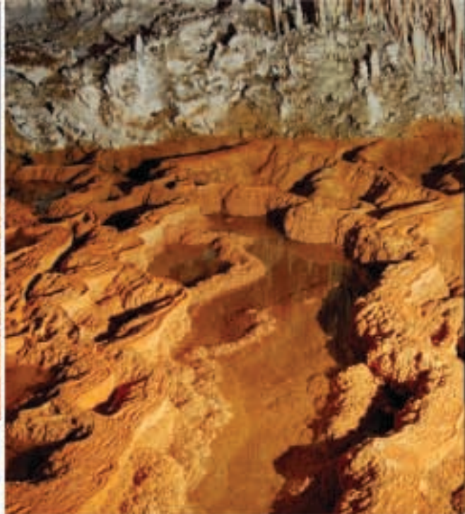
Fig. 5 Formations nodulaires dans le bord interne et micro-gours dans le bord externe des gours.