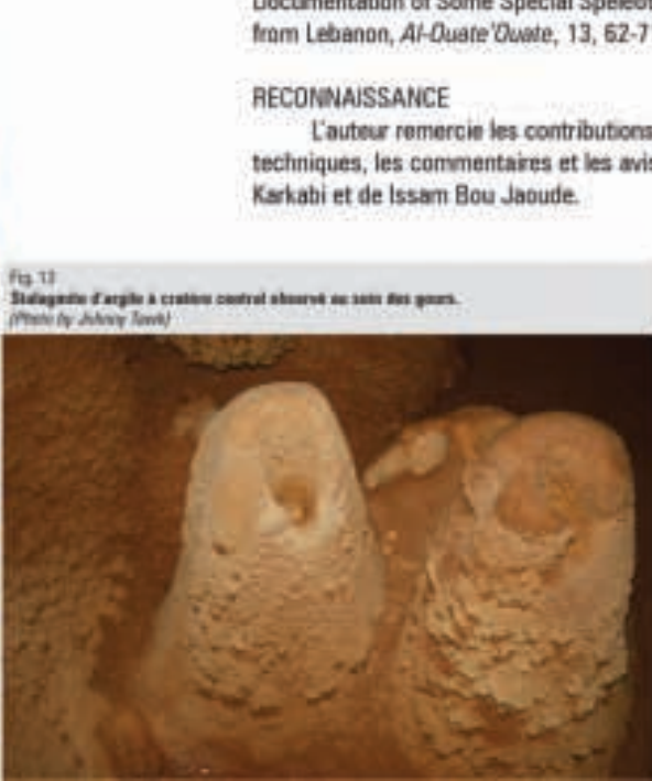
Fig. 13 Stalagmite d'argile à cratère central observé au sein des gours.