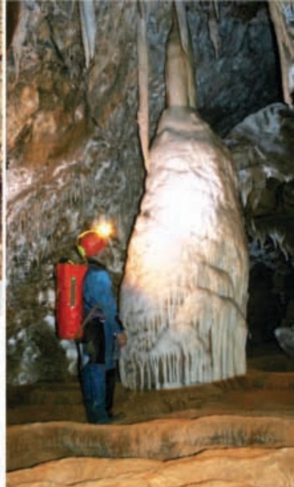
Fig. 11 Remarquable contraste formé par une colonne et des gours.

Galeries tranchent avec les gours et le plancher stalagmitique de couleur rouge.