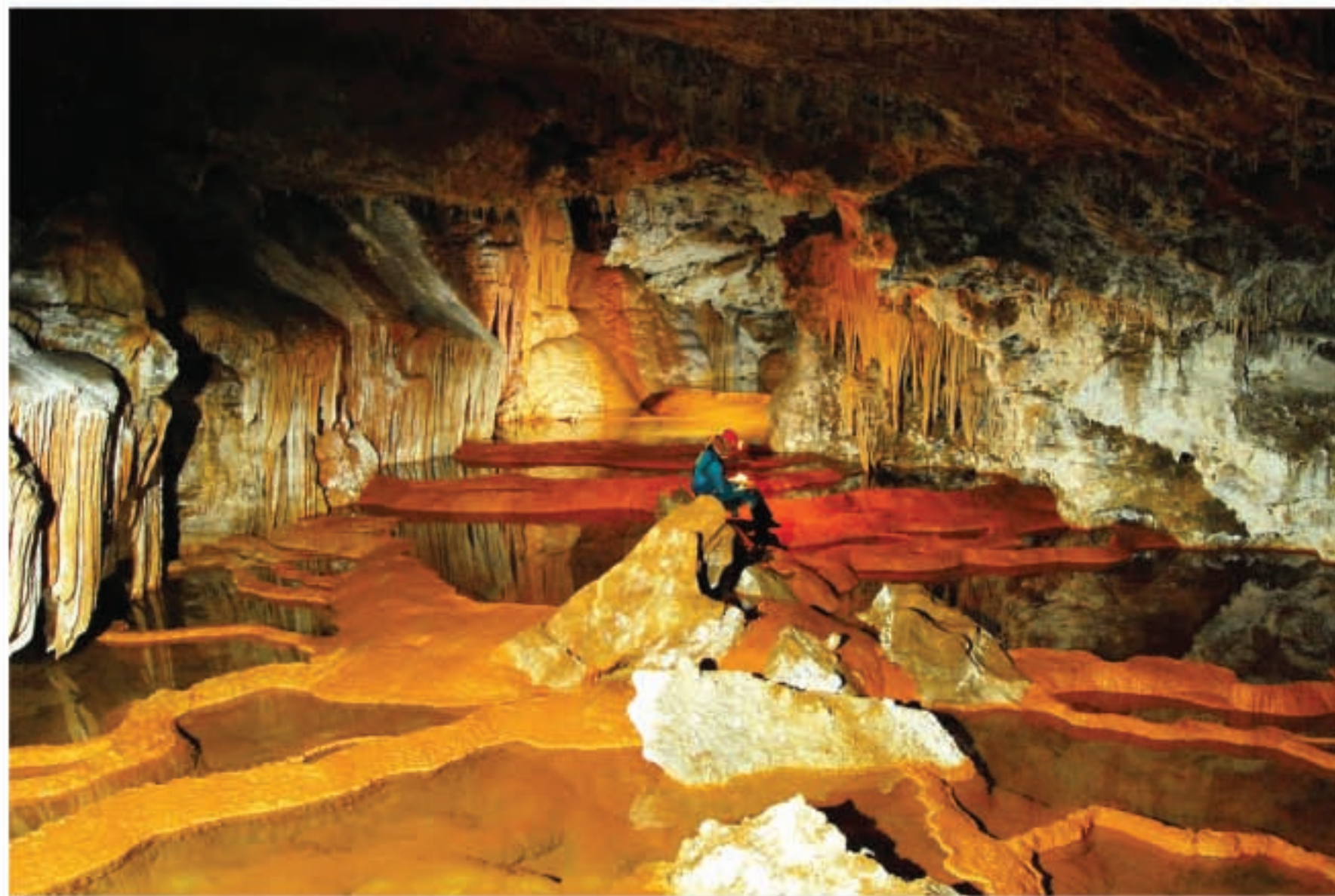
Fig. 2 Gours inondés dans la partie amont des Galeries Rouges.

Une description des Galeries Rouges de Jiita