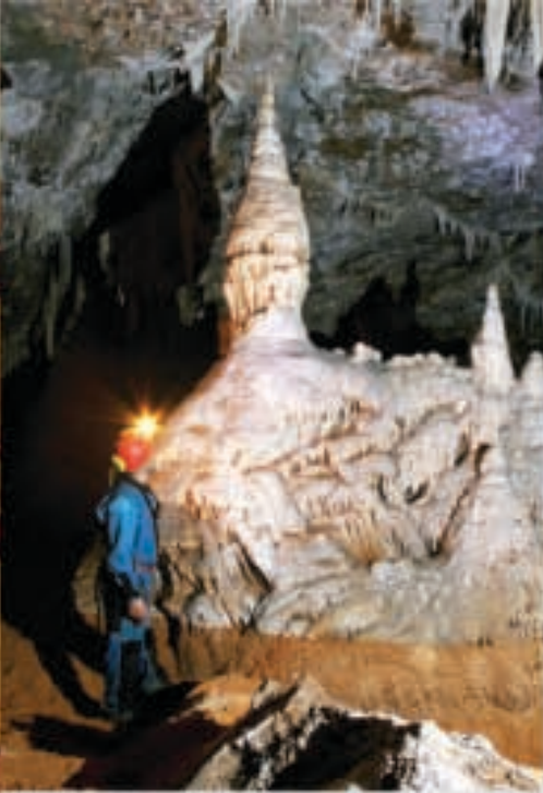
Fig. 6 Massif stalagmitique montrant à sa base le contraste blanc sur rouge marqué par le niveau de l'eau.