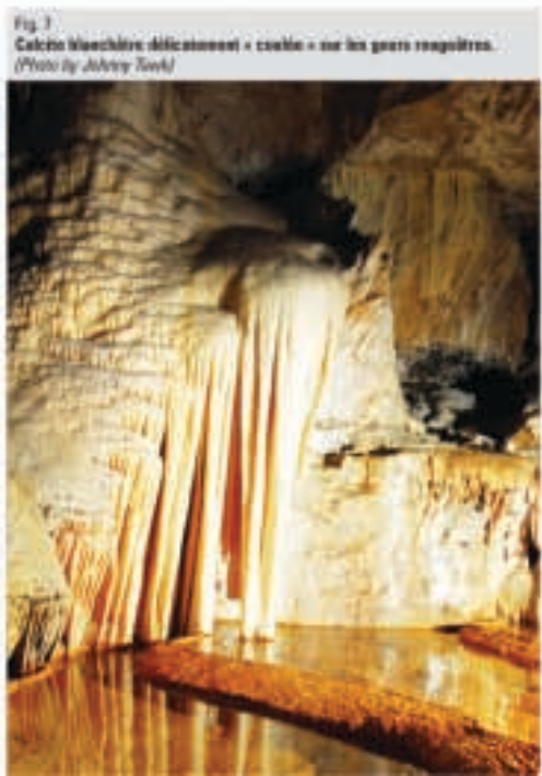
Fig. 7 Calcite blanchâtre délicatement « coulée » sur les gours rasés.