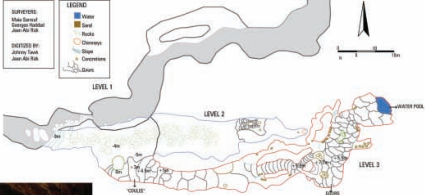
Fig. 1 Topographie des Galeries Rouges de Jiita.